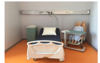
Salle de TP