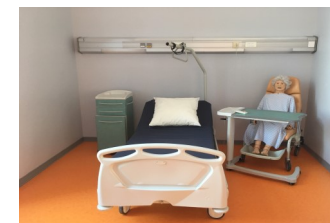
Salle de TP