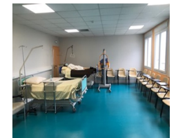
Salle de TP