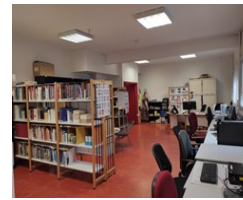
Centre de documentation