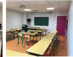
Salle de cours